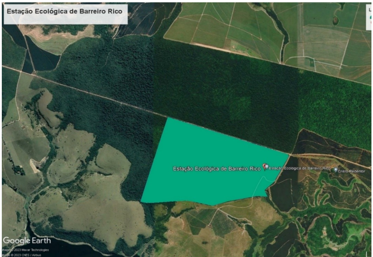
Figura 1 - Área da Estação Ecológica de Barreiro Rico, delimitada pelo polígono verde.

A fauna que habita a Estação atualmente, resistiu a inúmeras ações antrópicas, como a derrubada de matas para implantação de pastagens e plantação de algodão, a construção da estrada ANH 171, que seccionou o fragmento ao meio, incêndios florestais e supressão do remanescente florestal, que gerou dois fragmentos de 500 e 1.450 hectares. A Estação Ecológica ocupa 292,82 hectares do fragmento menor (500ha). Ainda, a Estação Ecológica apresenta uma proporção elevada de área sob efeitos de borda em relação ao interior do fragmento florestal (Fundação Florestal). Em torno da Estação ecológica, também há áreas de pastagens, lavouras de laranja, cana-de-açúcar e plantações de eucalipto. Além disso, há fragmentos menores espalhados em torno da ESEC que poderiam, possivelmente, ser conectados a ela.