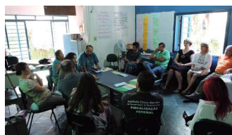
Discussões embasaram construção do mapa estratégico da UC

sua missão. Além disso, a equipe participou da elaboração de uma série de ações, metas e indicadores de acompanhamento da gestão para os próximos dois anos, o que colaborará para o alcance da visão de futuro do parque.