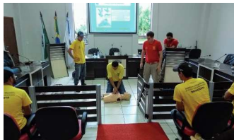
Brigadistas participam de treinamento de primeiros-socorros

Por ocasião do treinamento, a Reserva Biológica das Perobas também recebeu uma maca tipo mamute, doada pelo grupamento de Cianorte do Corpo de Bombeiros, para ser usada no transporte de feridos em ambiente com obstáculos, como florestas.