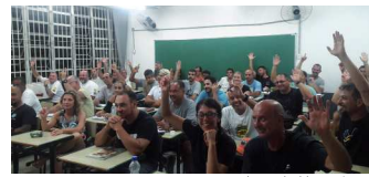
Novos condutores de visitantes do RVS

dos visitantes após a abertura do RVS, conforme as normas previstas e o Plano de Uso Público da Unidade.