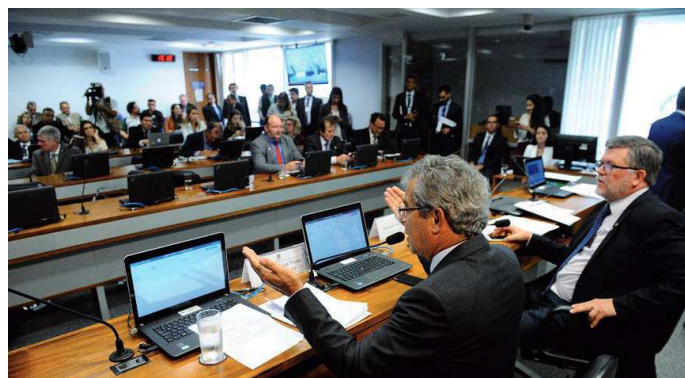
Jorge Viana apresenta relatório favorável à medida provisória

O presidente da Comissão Mista, Assis do Couto, afirmou que, pelo cronograma apertado, a Câmara dos Deputados deverá votar a MP 809 até 22 de abril, para o Senado votar até 13 de maio, tendo ainda nove dias de margem de manobra até a data limite de 22 de maio.