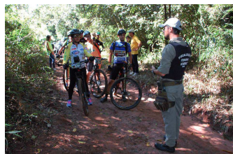
Volta Ciclistica das Perobas marcou aniversário da unidade

A Reserva Biológica (Rebio) das Perobas completou 12 anos no dia 20 de março com diversos motivos para comemorar. No último mês, a maior floresta do norte e noroeste do Paraná passou a contar com uma brigada de incêndios florestais permanente, cedida pelo município de Tuneiras do Oeste. Cinco brigadistas já estão recuperando aceiros e trilhas para proteger a reserva contra o fogo e permitir o acesso de equipes de fiscalização e pesquisa.