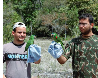
ICMBio em Foco - nº 462

O edital e os formulários de inscrição estão disponíveis em https://goo.gl/k4ngCj . A inscrição deve ser encaminhada exclusivamente para o e-mail pibic.icmbio@icmbio.gov.br .