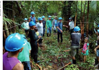
Técnicas apresentadas permitem aumento da produtividade