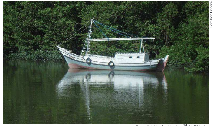
Reserva Extrativista Itapetininga beneficiará 1.100 famílias

Reivindicada pela comunidade de Bequimão, norte maranhense, com uma área de 16.786 hectares, a Reserva Extrativista Itapetininga beneficiará 1.100 famílias. A criação da irá contribuir para a sustentabilidade das atividades pesqueiras e extrativistas de subsistência e de pequena escala.