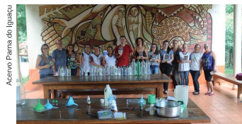
Participantes aprenderam a fabricar produtos naturais de limpeza

impacto do uso e manuseio de tais produtos sobre a saúde do corpo assim como a saúde do meio ambiente. Na sequência, os participantes aprenderam a fabricar seus produtos naturais e biodegradáveis e ganharam uma cartilha com as receitas e informação para contato. Segundo a pesquisadora, a limpeza doméstica é um ponto quente de poluição do nosso ambiente, gerando várias consequências indesejáveis como problemas de saúde individual e pública. “Existem maneiras extremamente simples de fabricar em casa produtos cuja ação seja semelhante ou até melhor em termo de eficiência de limpeza e que têm a grande vantagem de serem biodegradáveis”, afirmou. A equipe de servidores e terceirizados do parque e da UAAF foram convidados a participar da atividade, sendo extensivo o convite aos familiares. Aqueles que não puderam participar receberam uma cartilha com todas as informações básicas repassadas na oficina