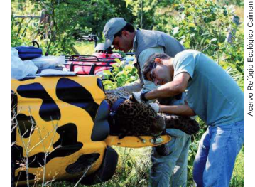
Bolsistas Pibic em atividade