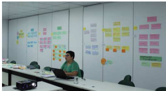
Reunião foi discutida no âmbito da gestão para resultados