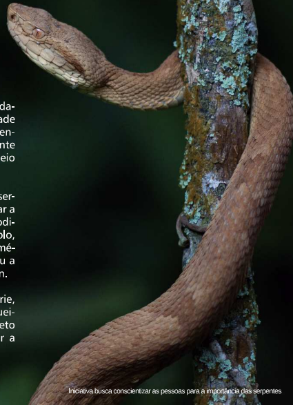
Iniciativa busca conscientizar as pessoas para a importância das serpentes