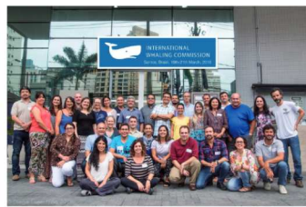
Representantes de países signatários elaboraram documento para apresentação no encontro anual do Comitê Científico da IWC

Além da discussão sobre o uso de botos como isca na pesca da piracatinga, a reunião também levantou questões referentes à caça intencional de botos para diversos usos, inclusive alimentação. Os participantes elaboraram um documento com todas as informações discutidas no evento e que será apresentado no encontro anual do Comitê Científico da IWC, que ocorrerá neste mês, na cidade de Bled, na Eslovênia.