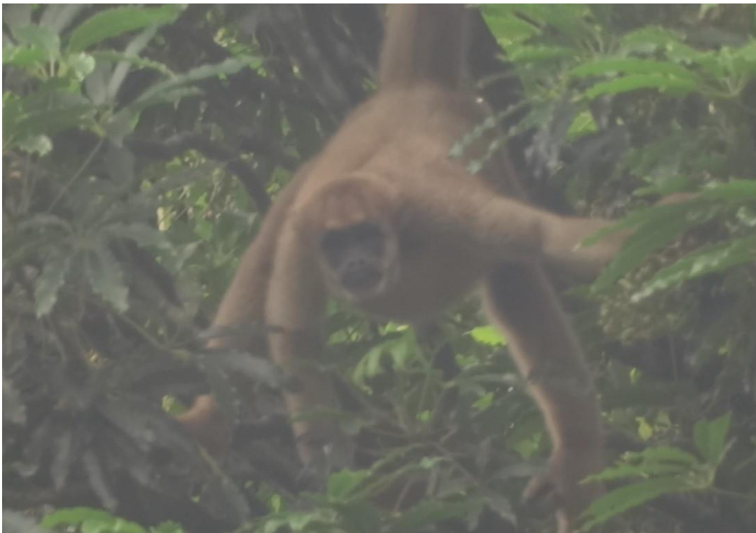
Figura 1 - Brachyteles arachnoides (miqui do sul) se alimentando de frutífera Schefflera sp.

Durante o monitoramento e os registros feitos por trabalhadores na área do Escalavrado - CDD, foi observado um grupo de miqui se alimentando em uma árvore frutífera (Figura 1). Uma observação feita em relação a essa árvore é que ela se encontra margeando a rodovia BR-116, um local de constante movimento de carros e caminhões durante dia e noite.