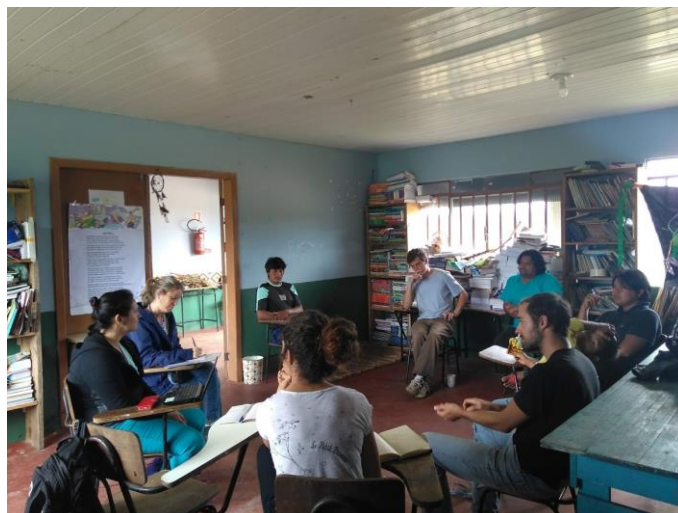
Figura 5: reunião entre UFPR, comunidade e educadores da aldeia Tupã Nhee Kretã

Após conversa, a qual aproximou o grupo de pesquisa com a comunidade, fomos convidadas para almoçar com os moradores, as crianças e professores, na escola. Este momento de partilha e troca de saberes nos aproximou da rotina, costumes, tempo e dinâmica da aldeia.