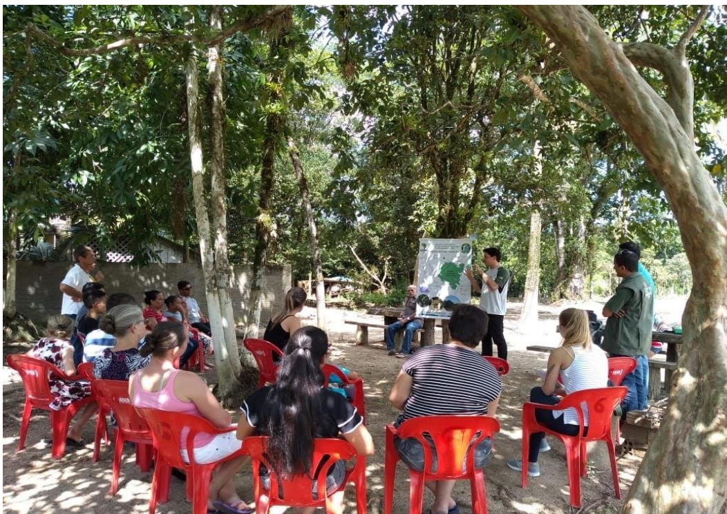
Figura 11: Encontro na comunidade da Limeira, entorno do PARNA Guaricana.

No dia 13 de março ocorreu uma reunião na Escola Estadual Indígena Jera Poty, localizada na Aldeia Tupã Nhé'e Kretã, junto a UFPR, com o intuito de dar continuidade na parceria iniciada no ano anterior. Foi feita uma apresentação dos projetos de Ambientalização Escolar e Ecologia de Saberes com Comunidades Tradicionais. A ideia foi firmar a parceria dos projetos de extensão com a escola e comunidade para que possam ser construídos de maneira coletiva entre as partes e sobretudo pela ótica prioritária da comunidade.