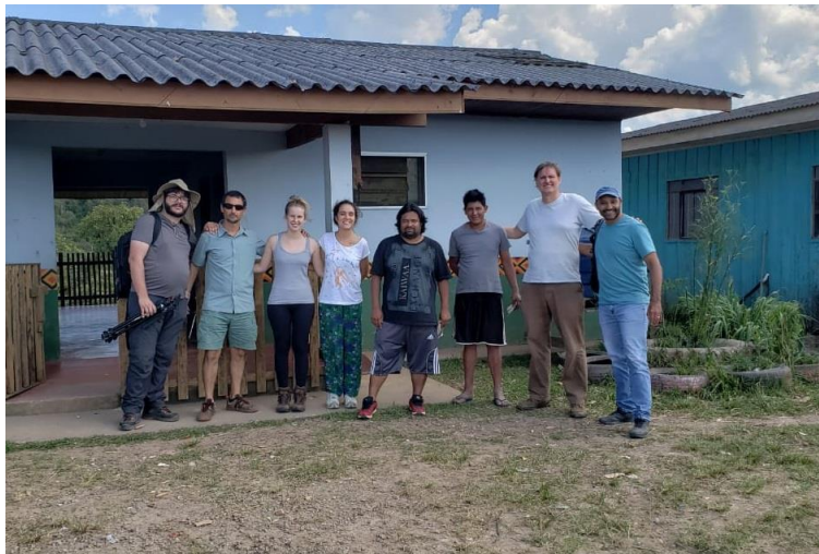
Figura 9: Reunião “Grande Reserva da Mata Atlântica” com Aldeia Tupã Nhe’é Kretã.

No dia 14 de dezembro realizamos uma visita à aldeia (Figura 9), acompanhando o grupo que está articulando a criação da “Grande Reserva da Mata Atlântica”, considerando que boa parte do PARNA Guaricana está incluso nesta área contínua de quase um milhão de hectares de Mata Atlântica. A proposta é relevante para que esse bioma, rico em biodiversidade, possa ter visibilidade nacional e internacional e, por consequência, fomentar o apoio às UCs presentes em toda a extensão da Reserva, que não é uma UC, mas uma estratégia de mobilização para conservação. Foi feita uma apresentação do projeto da Grande Reserva e discutido o interesse da parceria com a comunidade, já que o propósito da iniciativa é também fomentar a cultura e as comunidades que compõem esse ecossistema.