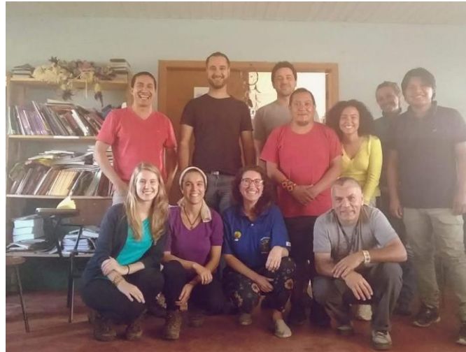
Figura 1: reunião entre representantes indígenas, FUNAI, UFPR e ICMBio.

sistematizados para embasar a elaboração do termo. Para isso iniciamos uma compilação desses dados com os pontuados em reuniões, criando um documento que ainda está em elaboração, a partir do Protocolo e plano de consulta para construção participativa do termo de compromisso entre ICMBio e indígenas .