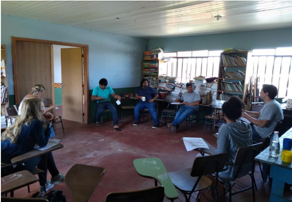
Figura 10: Encontro do dia 8 de fevereiro de 2019 na Aldeia Tupã Nhe'é Kretã.

No dia 23 de fevereiro, sábado, no período da tarde, realizamos uma visitada a comunidade da Limeira, localizada no entorno do Parna Guaricana (Figura 11). Durante o encontro foi falado sobre a formação do Conselho do Parque, convidando a comunidade para participar. Nessa ocasião também foram sanadas dúvidas de vários moradores em relação a como o Parque pode influenciar na dinâmica de vida deles, tanto de forma positiva (turismo, conservação), quanto negativamente (parte de terrenos que foram incluídos dentro do parque). Os moradores inicialmente se mostraram bem receosos, nos contaram que sempre escutam relatos negativos em relação a criação de áreas protegidas (Guaraqueçaba, Barra do Turvo). A comunidade vive, principalmente, do cultivo de banana ouro e extração de recursos naturais, como a palha e organiza-se por meio de uma associação chamada APRULI (Associação dos Produtores Rurais da Limeira).