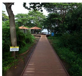
Trilha do Sancho DEPOIS.