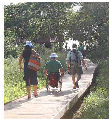
Trilhas com acessibilidade no Parque.